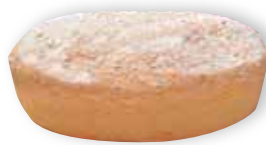
Le gâteau de Savoie