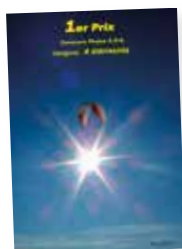
1 ER PRIX 4 éléments