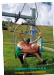
1 ER PRIX Insolite