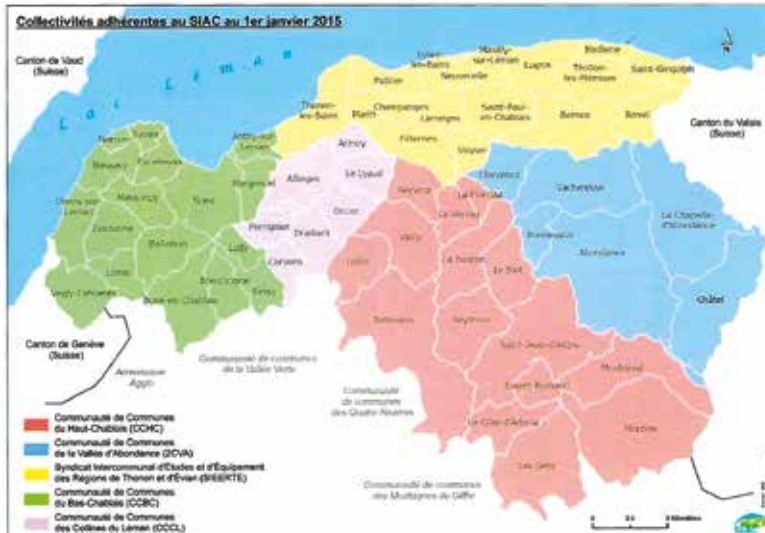
SIAAC : Syndicat Intercommunal d'Aménagement du Chablais