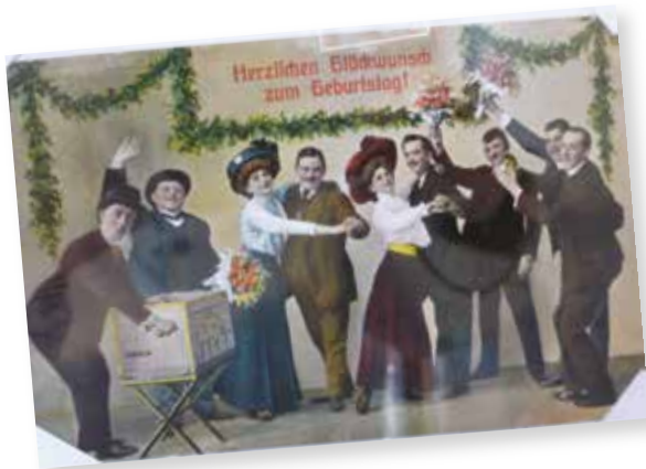
Exposition de cartes postales

28 décembre 2015 à l'occasion des 120 ans de la première projection publique du film des Frères Lumière dans la salle de cinéma du musée Denis Bouchet nous a invités à la présentation d'un film muet « le monde des automates » accompagné par l'orgue de cinéma du musée puis il nous a présenté le plus vieil ouvrage de la collection du musée un livre datant de 1615 de Salomon De Caus « les raisons des forces mouvantes ». A l'issue de ces représentations les invités se sont retrouvés autour d'un verre de l'amitié.